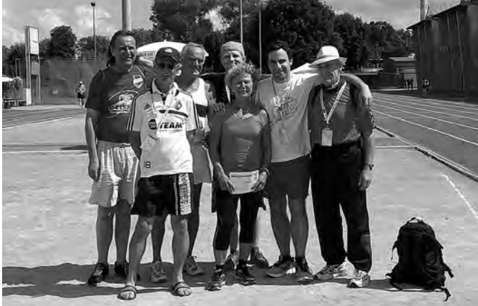
Ein Hauch von Olympia in Ulm